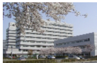
主たる実習先である東京医療センター

平成22年4月に設置する大学院看護学研究科では、独立行政法人国立病院機構と連携して高度実践看護能力を備えた「診療看護師(NP:ナースプラクティショナー)」を育成します。「診療看護師」とは、人々の健康増進からリハビリテーションまでを総合的、継続的にケアする看護職です。大学院看護学研究科においては、医療現場が抱えるさまざまな問題を解決し、さらなる医療の効率化とケアの質の向上のために、患者を総合的、継続的にケアできる「診療看護師」の育成を図っていきます。