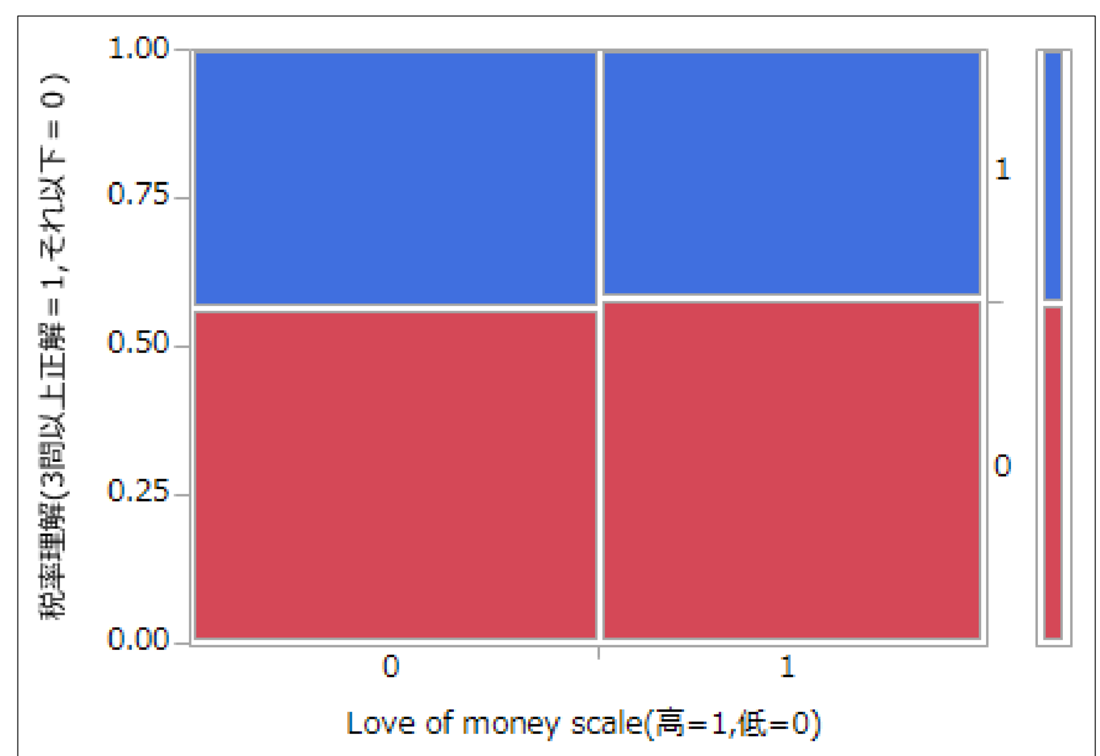
図1.税率とLove of money scale