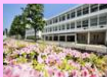
五反田キャンパス