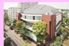
世田谷キャンパス