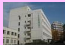
国立病院機構キャンパス